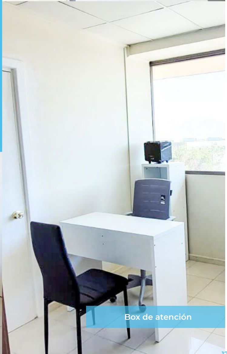
Box de atención